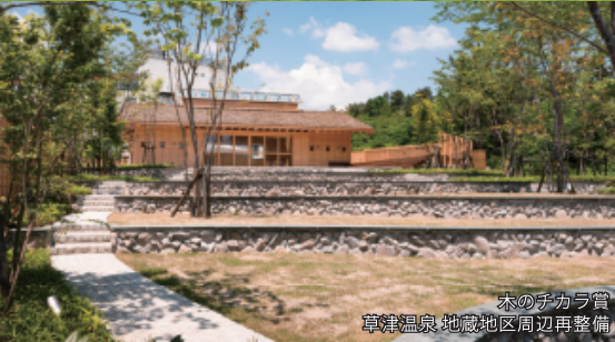
木のチカラ賞 草津温泉 地蔵地区周辺再整備