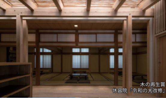
木の再生賞 休昌院『令和の大改修』