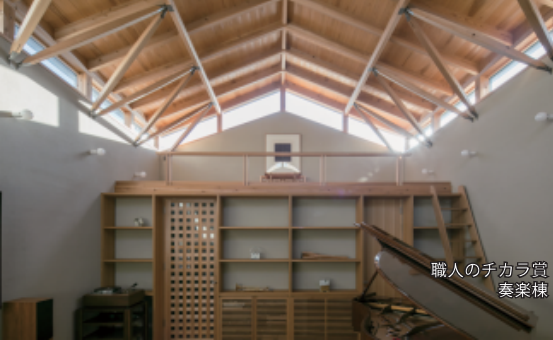
職人のチカラ賞 奏楽棟