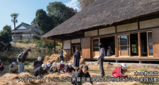
木の教育賞 大学サテライトとしての茅葺民家の再生と地域における実践活動