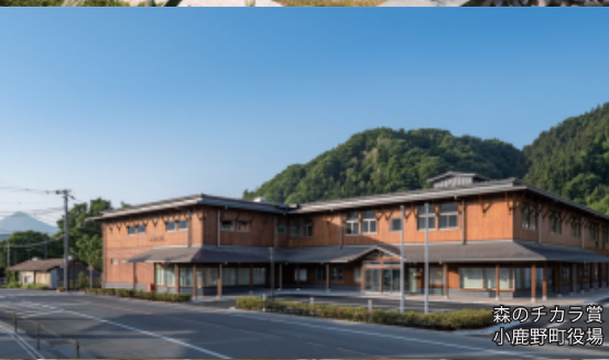
森のチカラ賞 小鹿野町後集