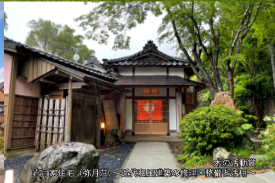
木の活動賞 岩月家住宅（弥月荘）～近代和風建築の修理・整備と活用～