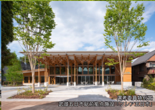
選考委員特別賞 武蔵五日市駅前拠点施設「フレア五日市」