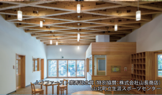
ムクファースト崇秀記念賞(特別協賛:株式会社山長商店) 山北町立生涯スポーツセンター