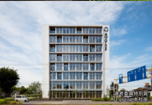
選考委員特別賞 AQ group 本社屋