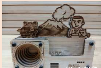
ドラムミュージック和隊