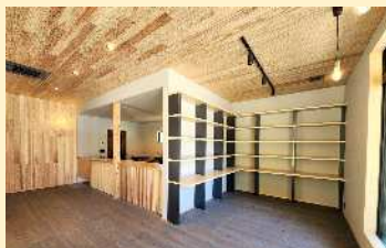
マル川建設(株) 複合施設「椋」 (施設の木造化)

○施設の整備・製品の設置 県産材を積極的に活用したデザイン性・機能性等に優れた「施設の木造化」、「内装木質化」及び「木製品の設置」の取組