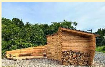
鹿児島大学大学院理工学研究科 木造サウナ小屋「FiKaSauna」 (学生デザイン活用枠)

○木製品の開発及び普及 県産材の需要拡大につながる新たな「木製品の開発及び普及」の取組（「一般枠」及び「学生デザイン活用枠」）