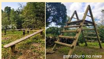
リス道・丸太のぼり (教育資材等の整備)

○机・椅子や教育資材等の整備 未就学児や小学生等が使用する県産材を積極的に活用した「机・椅子」や「教育資材」などの整備の取組